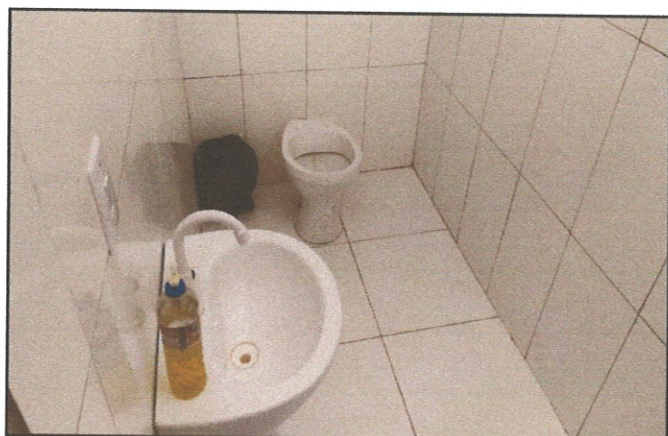
FIGURA 05 - Ausência de barras de acessibilidade