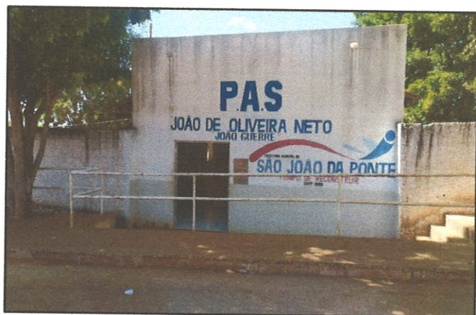
FIGURA 01 - Fachada UBS