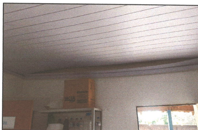
FIGURA 06 - Forro danificado