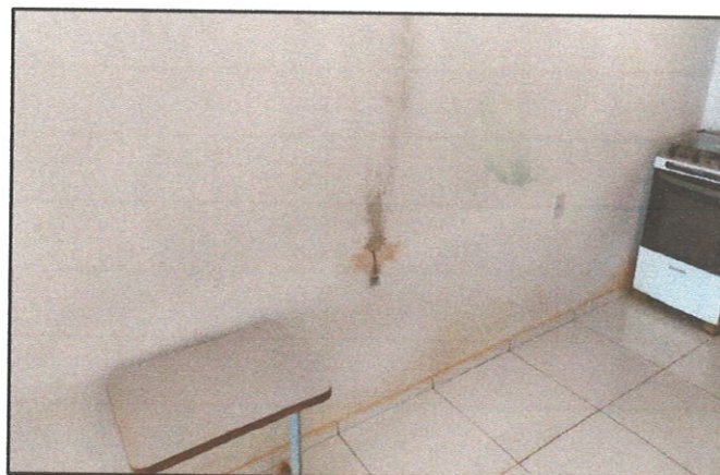
FIGURA 04 - Manchas nas paredes internas