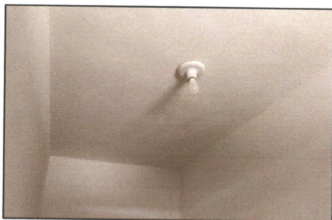
FIGURA 03 - Lâmpada queimada