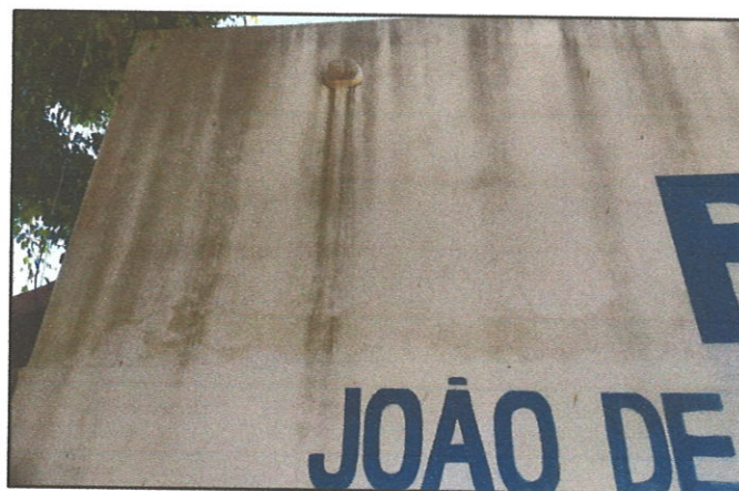
FIGURA 02 - Manchas na fachada